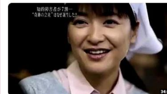
【日本理化学工業株式会社】 8.8万 視聴者・2年前 まちとめて... 「あなたにはなぜ働くのですか？」～日本一優しい会社が開いた50年～（ドキュメンタリードラマ作品）【出演者】伊藤...