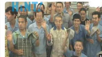
ヒント9「働く幸せ」/日本理化学工業 byアンテリジャン 4.3万 視聴者・14年前 HKTchannel 働く人の喜びの源泉は、そんな会社があります。競争社会の民間企業で収益を上げながらです。それはチョコ製造で...