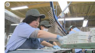
「働く幸せ」障害者雇用続けて半世紀 日本理化学工業 2022年6月8日放送 6.9万 視聴者・1年前 HBCニュース 北海道放送 50年以上前から知的障害がある人を積極的に雇い入れ、「人を幸せにする」ことを経営している会社が北海道美幌市にあります。